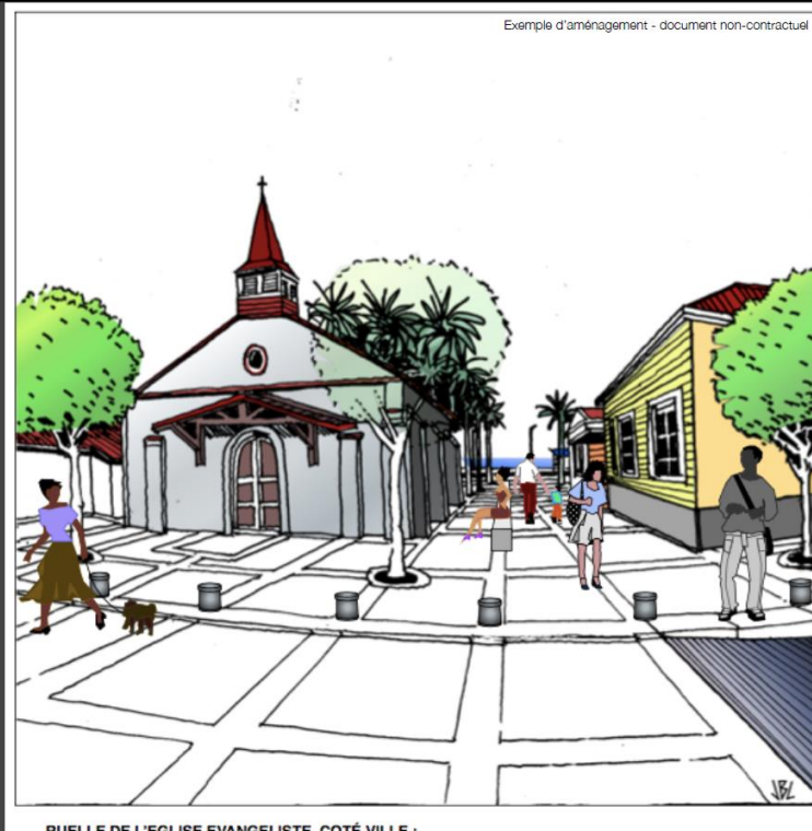
RUELLE DE L'ÉGLISE ÉVANGÉLISTE, COTÉ VILLE :